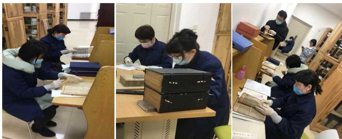
文献修复组工作人员在陕西省中医药大学图书馆古籍室清点书叶

该项目是陕西省图书馆与陕西中医药大学跨地区、跨领域合作的有益实践，是推进我省古籍修复保护工作的又一次重要历练。通过此项目中双方的协作付出，必将会加快推进越来越多的古籍修复保护项目落地落实，为后续此类合作提供借鉴参考，期待更多的珍贵的善本古籍能够“继绝存真 传本扬学”！